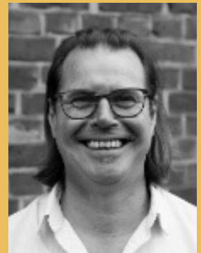
Kjell Kunstnerisk leder