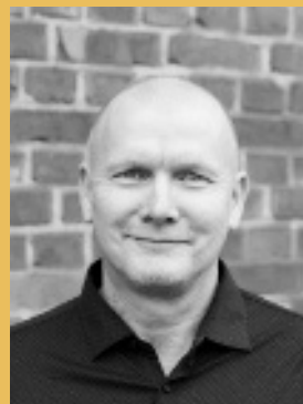
Ådne Teatersjef/ Daglig leder