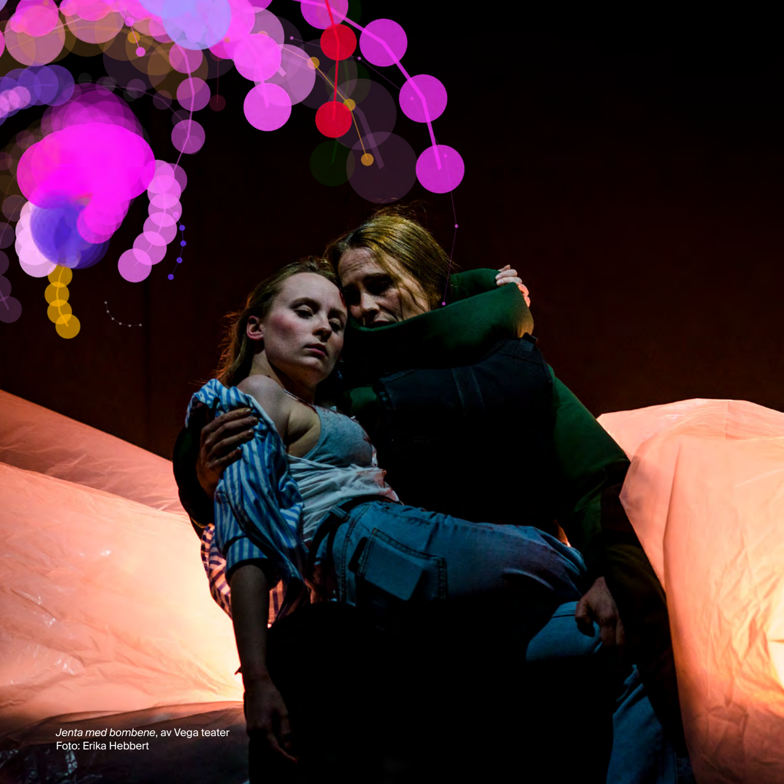
Jenta med bombene , av Vega teater Foto: Erika Hebbert